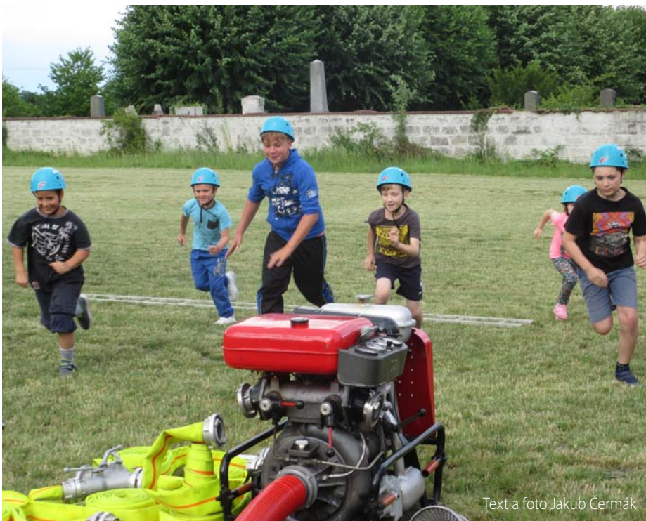
Text a foto Jakub Čermák

Na závěr bych chtěl poděkovat SDH Velký Újezd, SDH Horní Beřkovice, Fk Nebužely, hospodě v sokolovně a Tereze Cerhové za pomoc při přípravě i v průběhu celého dne. ■