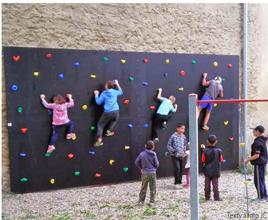
Texty a foto JČ