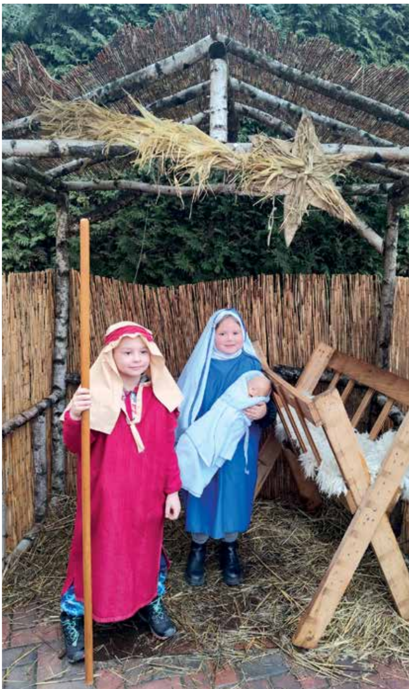
Text kolektiv MŠ